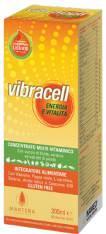
VIBRACELL 300 ml