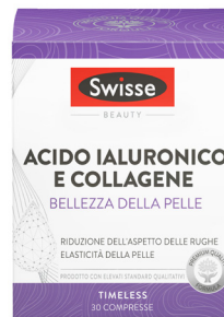
SWISSE ACIDO IALURONICO E COLLAGENE Bellezza della pelle 30 compresse