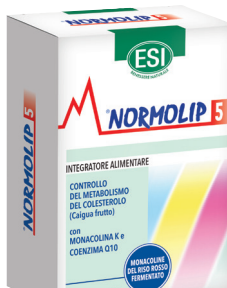
NORMOLIP 5 60 naturcaps