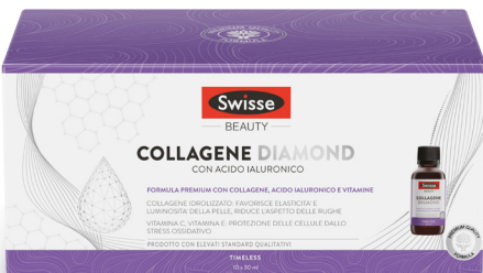
SWISSE COLLAGENE DIAMOND 10 flaconcini da 30 ml