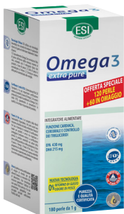
OMEGA 3 EXTRA PURE 120 perle + 60 perle in omaggio da 1 g