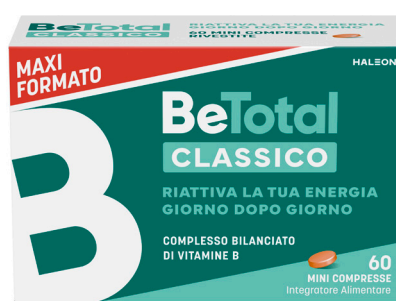
BETOTAL CLASSICO 60 compresse